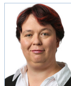
Lucie Grimm Mediaberatung

tel +49 (0) 611 / 78 78 – 146 ingo.rosenstock@springernature.com