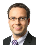
Thomas Heusler Mediaberatung

tel +49 (0) 611 / 78 78 – 146 ingo.rosenstock@springernature.com